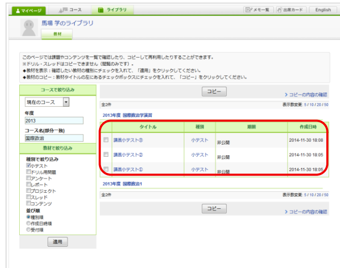
ライブラリ(教材絞り込み後)